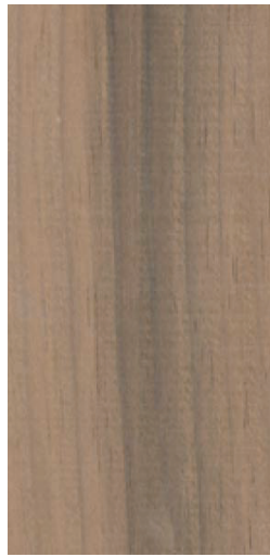
Pin maritime rétififié®